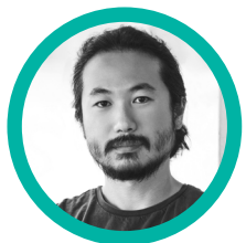
ДЖЕ АН (ЛОНДОН)